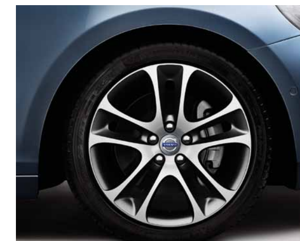
„Atrius Diamantschnitt/Grau“ 7,5x18-Zoll. Satz Sommer-Komplettäder mit Bereifung Michelin Pilot Sport, 225/40R18.