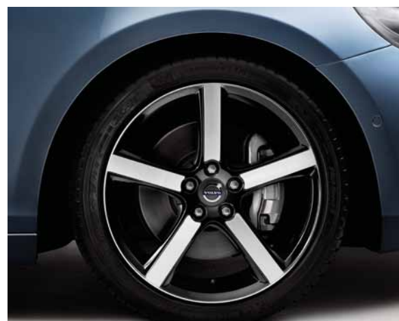
„Midir Diamantschnitt/Schwarz“ 7,5x18-Zoll. Satz Sommer-Komplettäder mit Bereifung Michelin Pilot Sport, 225/40R18.

Weitere Informationen zum Volvo V40 Zubehör finden Sie unter www.volvocars.de/zubehoer