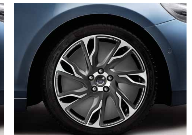
„Ailos“ 7,5x18-Zoll. „Aerodynamic Disc Concept“. Satz Sommer-Komplettäder mit Bereifung Michelin Pilot Sport, 225/40R18. Die Leichtmetallfelge Ailos besteht durch individuelles Design und innovative Details. Die Felge ist durch dunkelgraue Kunststoffensätze aerodynamisch optimiert, um den Luftwiderstand zu reduzieren. Durch das integrierte Dekor, wahlweise erhältlich in den Farben Weiß, Rot oder Lime, ist die Felge perfekt auf die Dekorstreifen des optionalen Designpaketes abgestimmt.